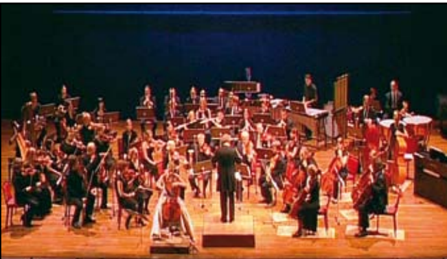
Symfoniorkestern "Helsinki Sinfonia" Sinfoniaorkesteri